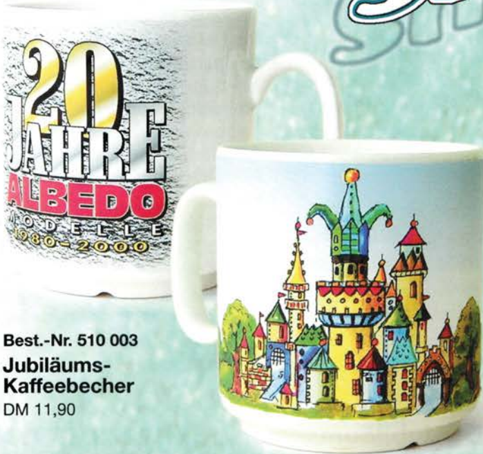
Best.-Nr. 510 003 Jubiläums-Kaffebecher DM 11,90