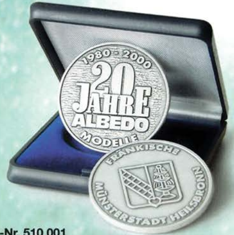
Best.-Nr. 510 001 Jubiläums-Medaille versilbert mit Etui, 40 mm Ø limitierte Auflage von 200 Stück mit Zertifikat DM 69,90